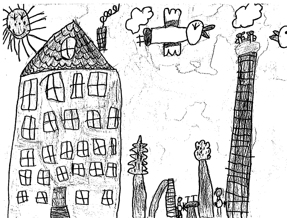
Obrázek z MŠ Masarykova, Holešov

Dnešní děti jsou zvyklé, že máma se postará, připraví, pomůže, připomene. Když takovou